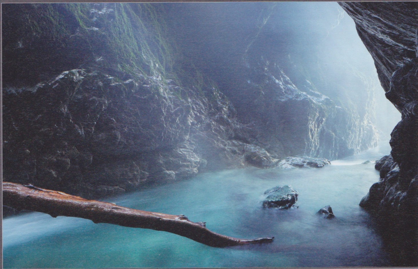
Canyon de Falls Creek. Passage resserré juste après une cascade de 70 m, dans les embruns et un courant à décoller les oreilles (Nouvelle-Zélande).

Unwirkliches Türkis eines Quellaustrittes im Canyon von Artuby (Verdon, Frankreich).