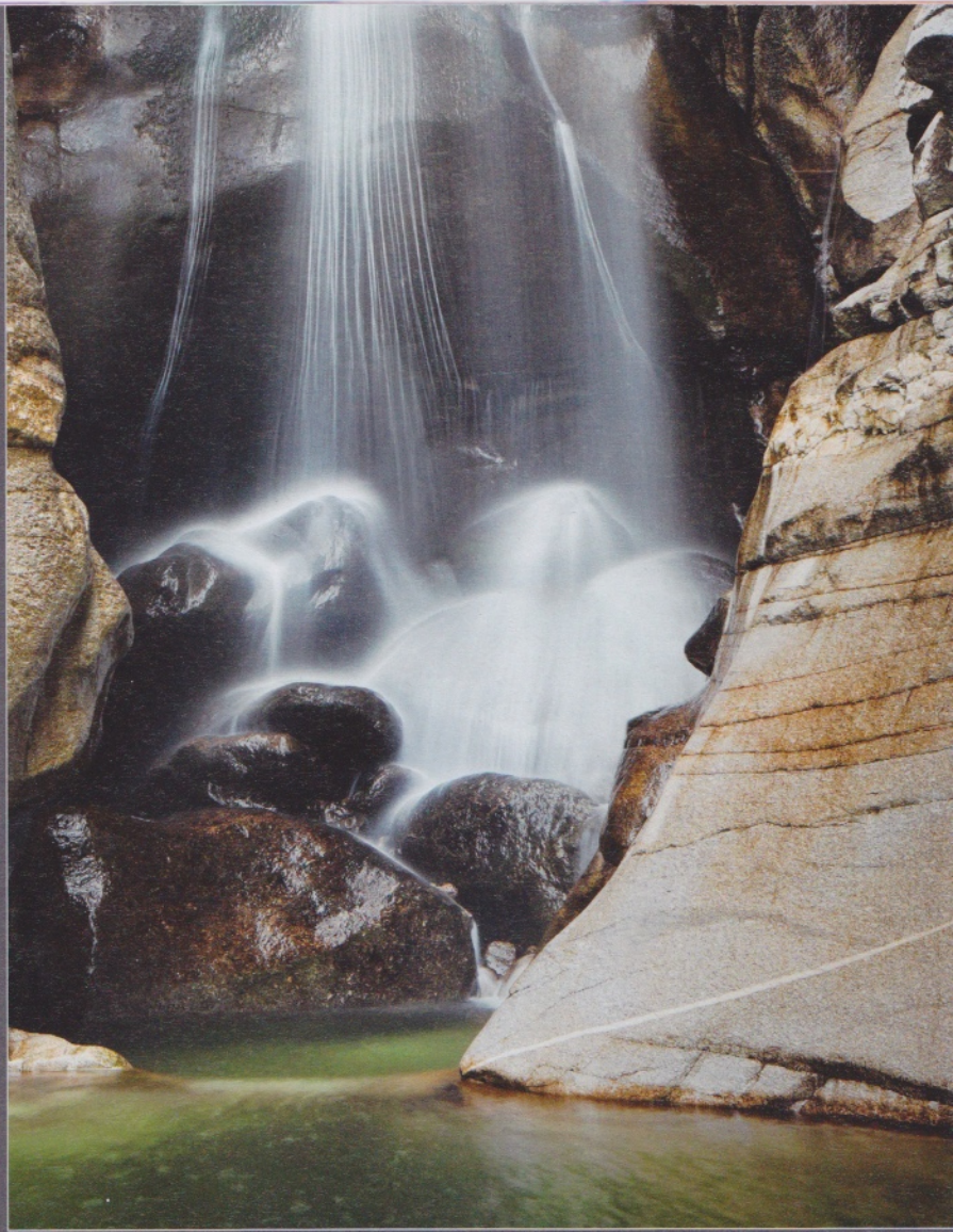
Canyon du Val d'Ambra, (Tessin, CH).