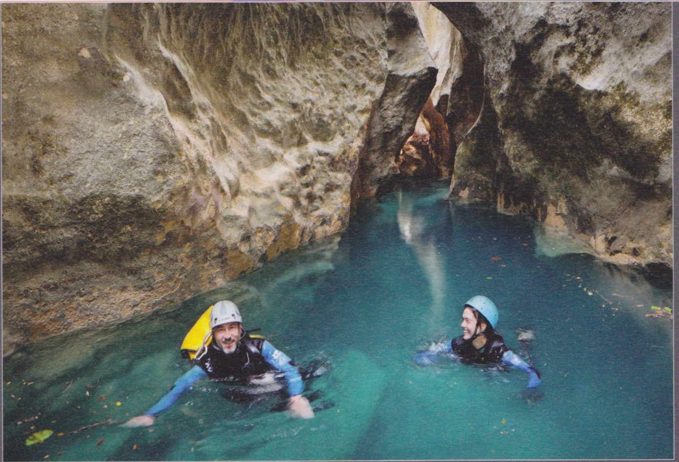
Turquoise irréel d'une résurgence, dans le canyon de l'Artuby (Verdon, France).

Unwirkliches Türkis eines Quellaustrittes im Canyon von Artuby (Verdon, Frankreich).