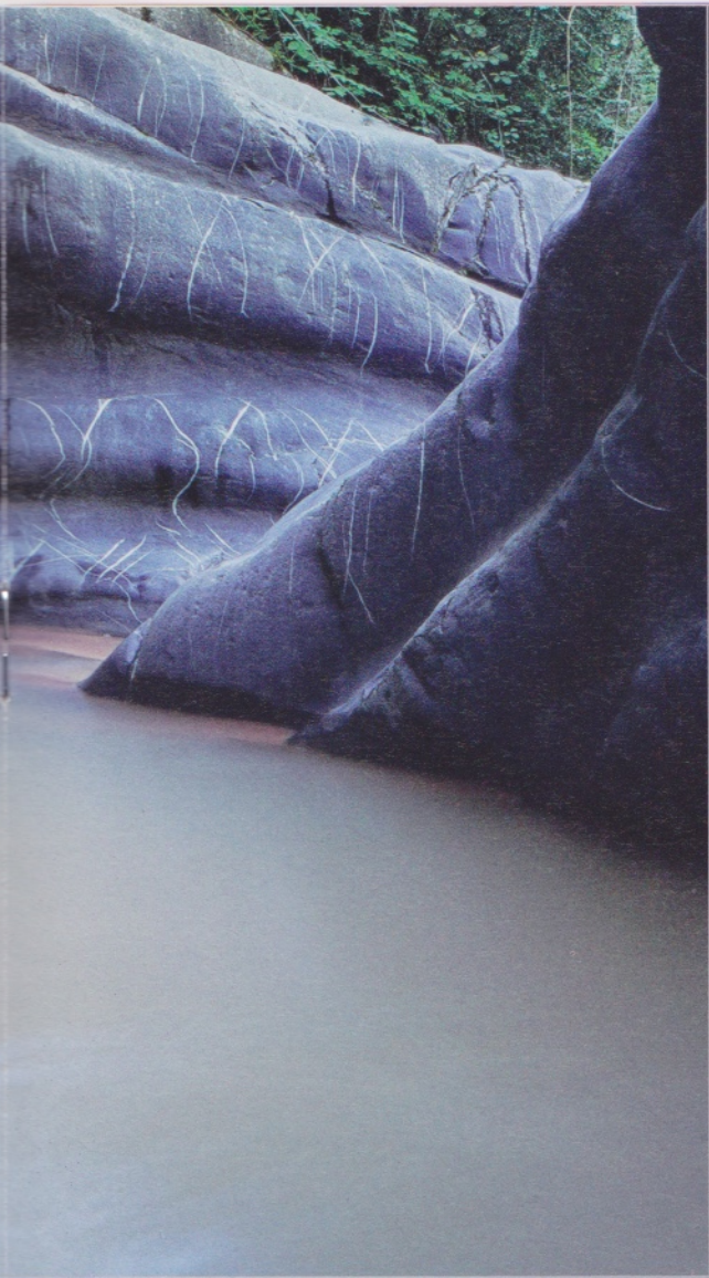
Canyon de la Roudoule (F).